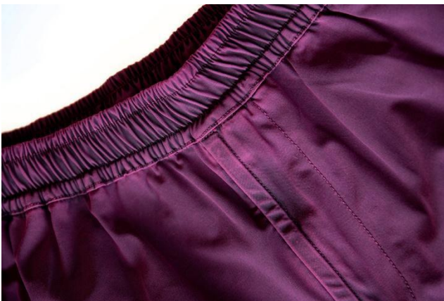
Sensitive® Fabrics by EUROJERSEY e TINTORIA EMILIANA

EUROJERSEY - Fondata nel 1960, EUROJERSEY Spa – Azienda del Gruppo Carvico - rappresenta nel settore dei tessuti tecnici indemagliabili lo stile e la creatività del Made in Italy interpretati dai tessuti Sensitive® Fabrics , scelti dai principali marchi del settore abbigliamento, sport, costumi da bagno e lingerie. L'Azienda si colloca al vertice dell'industria tessile mondiale grazie ad uno stabilimento all'avanguardia disegnato dal famoso architetto Antonio Citterio e rappresenta un esempio unico di efficienza e produttività. Una superficie di 40.000 metri quadrati , con una squadra di 260 persone e un unico impianto a ciclo completamente verticalizzato, dalla tessitura, alla tintoria, al finissaggio alla stamperia. EUROJERSEY ha una capacità produttiva annua pari a 13 milioni di metri di tessuto .